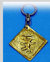
真鍮アクセサリー