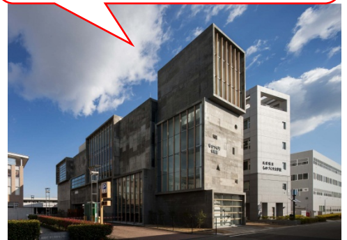
兵庫県立ものづくり大学校 ものづくり体験館 姫路市市之郷1001-1

「ものづくり体験館」では、その道のプロの匠や熟練技能者から「ものづくり」の指導を受けることで、ものづくりの楽しさ、奥深さを体験します。