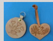
革のキーホルダー